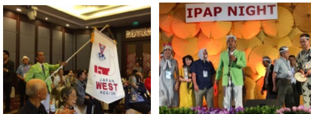
バナーセレモニー カルチャーナイト (炭坑節)

それを受けて、YES 基金については、6 名の委員が再選出され、明確な活用の仕方が提示されることになりました。