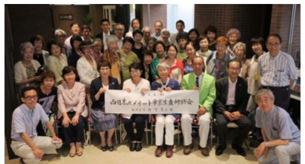
神戸 YMCA 新会館ロビーにて記念撮影